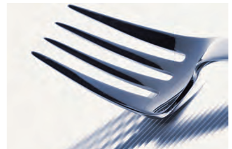
Fabricación de cubertería