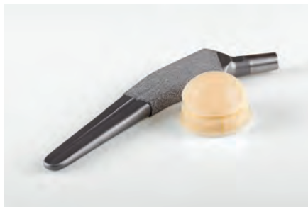
Fabricación de implantes