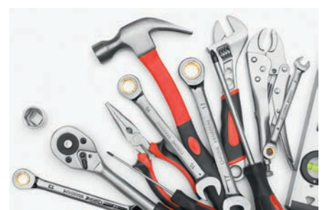
Fabricación de herramientas