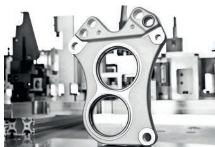
Piezas de fundición de aluminio