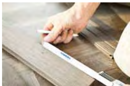
Parquet sin tratar