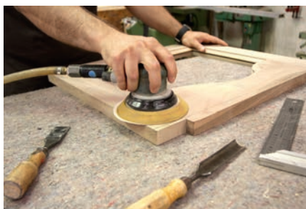
Industria del mueble