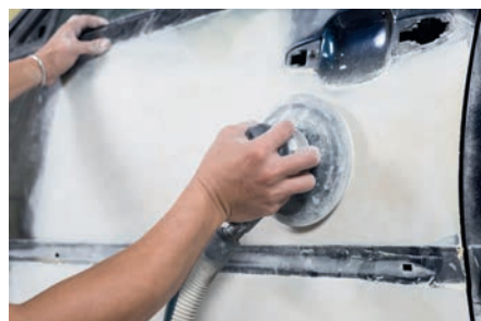
Reparación del automóvil