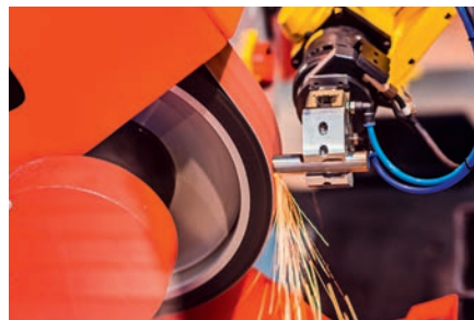
Uso generalizado en amoladoras de banda