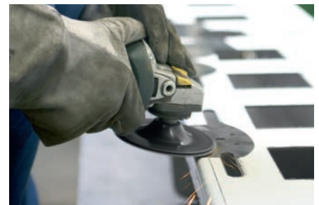
Tratamiento general del metal