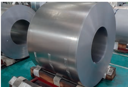
Tratamiento de bobinas