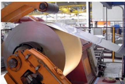
Tratamiento de bobinas y chapa gruesa