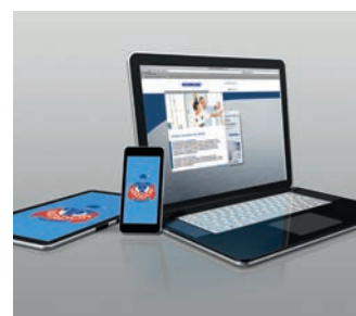
Industria de la electrónica