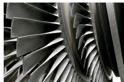
Palas para turbinas