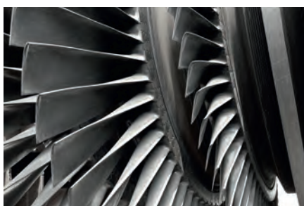
Palas para turbinas