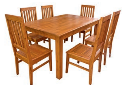
Industria de la madera y del mueble