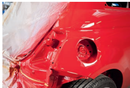
Reparación del automóvil