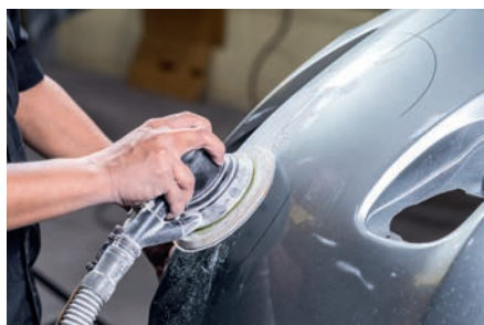
Reparación del automóvil