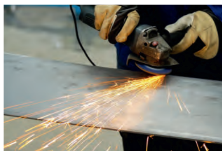
Mecanizado de chapas de acero