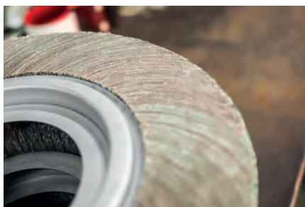
Material base para cepillos de láminas con agujero