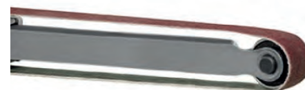
Bandas abrasivas para lijadoras eléctricas y neumáticas