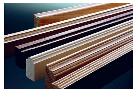
Industria del mueble | Lijado de lacas