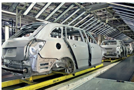
Industria del automóvil | Imprimación KTL