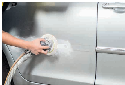
Reparación del automóvil