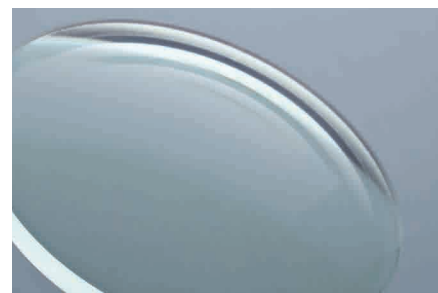
Material base para abrasivos para lentes