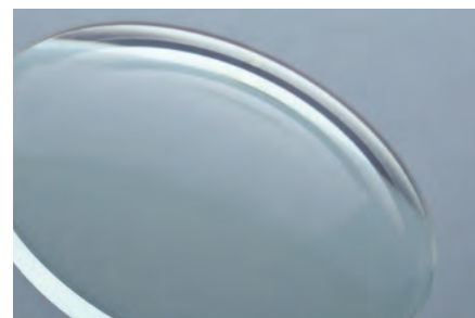
Material base para abrasivos para lentes