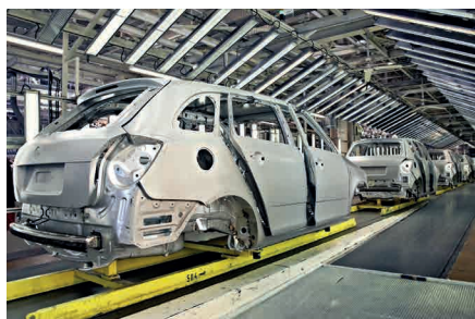
Industria del automóvil