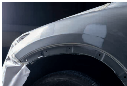
Reparación del automóvil