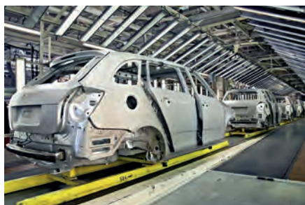
Industria del automóvil