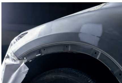
Reparación del automóvil