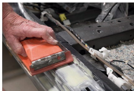
Lijado a mano - Carrocería