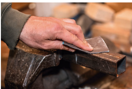
Lijado a mano en general - Metalistería