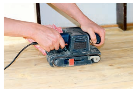
Lijadoras de banda para tratamiento de madera