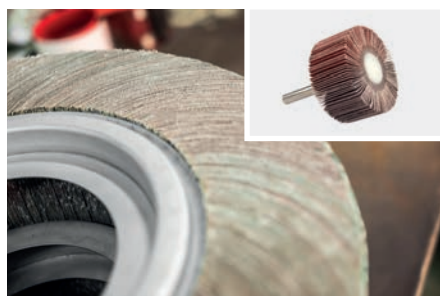
Material base para cepillos de láminas con vástago y con agujero