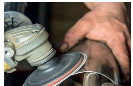
Lijado de chapas