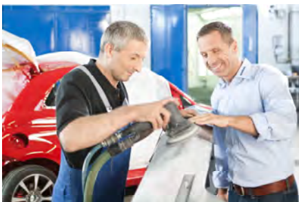
Talleres de plancha y pinturas