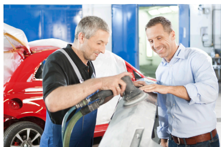
Industria del automóvil