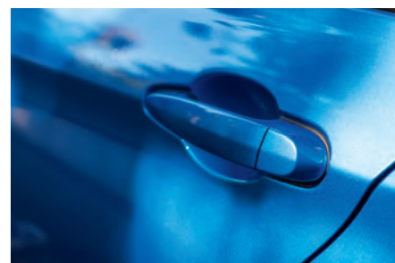
Tirador de plástico para puertas de coche