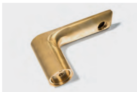
Industria de herrajes