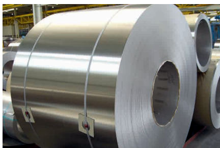
Lijado de bobinas y chapa fina de acero