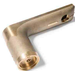
Industria de herrajes