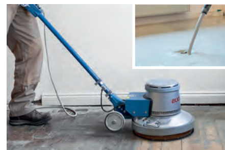
Restauración de suelos | Lijadoras de disco Capa de anhídrita | Lijado plano