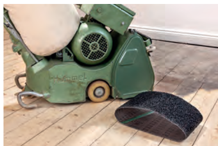
Restauración de suelos | Lijadoras de banda