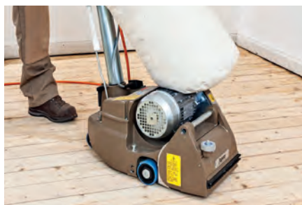
Restauración de suelos | Lijadoras de rodillo