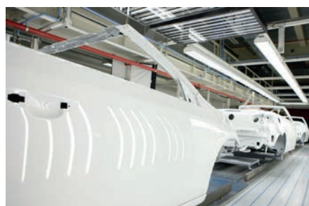
Industria del automóvil