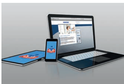
Industria de la electrónica