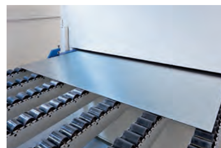
Lijado de chapa fain