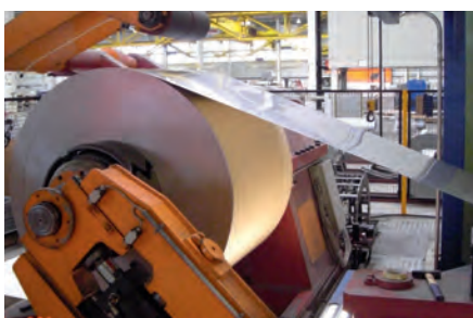
Lijado de bobinas