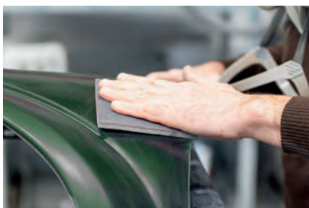
Reparación del automóvil