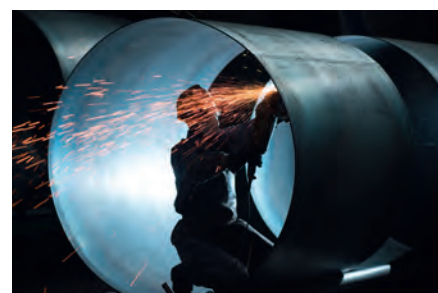
Fabricacion de tubos y contenedores