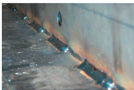
Tratamiento de soldaduras angulares