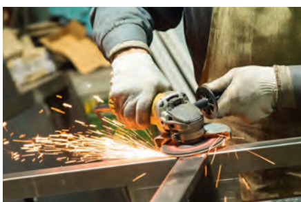
Tratamiento de juntas de soldadura en general