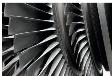
Pás de turbina