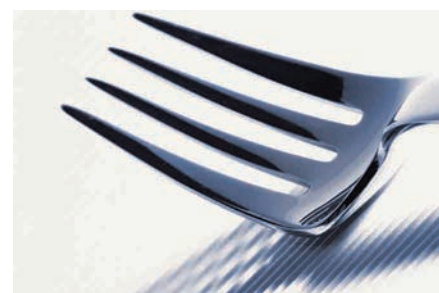
Fabrico de cutelaria