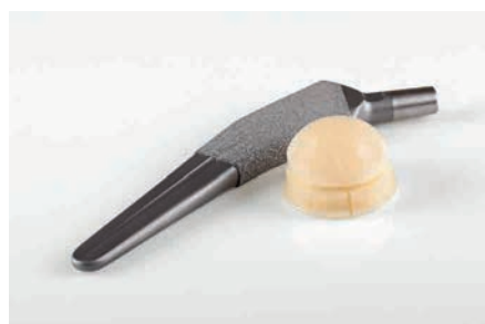
Fabrico de implantes