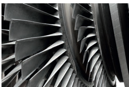
Pás de turbina