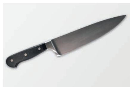
Facas e cutelaria