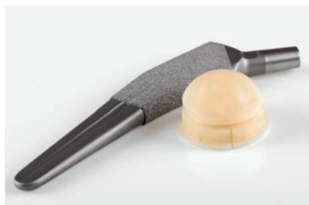
Fabrico de implantes