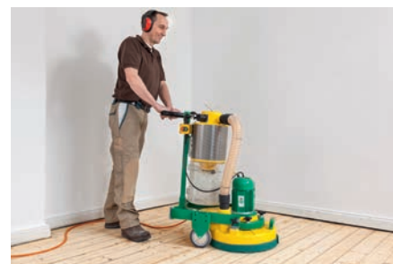
Pré-Lixagem e lixagem de acabamento | Discos abrasivos