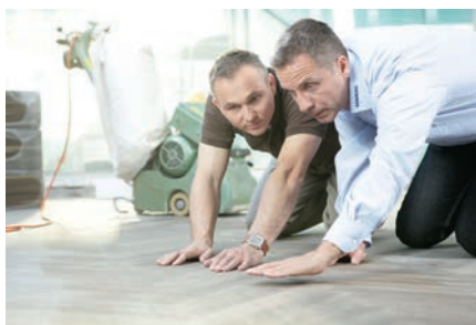
Lixagem de calibração y de acabamento | Cinta abrasiva