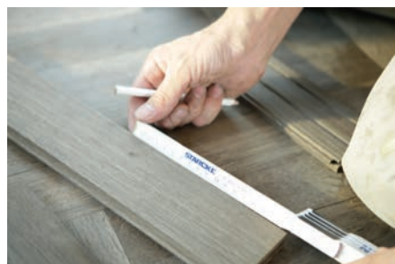
Parquet não tratado