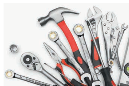
Fabrico de ferramentas