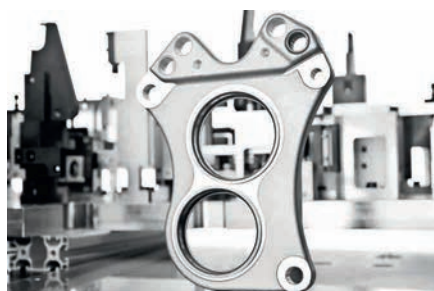
Peças fundidas em alumínio