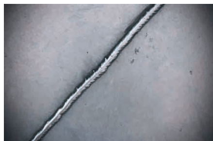
Cordão de solda