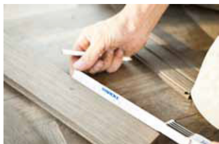
Parquet não tratado