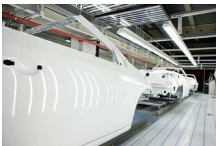
Indústria do automóvel