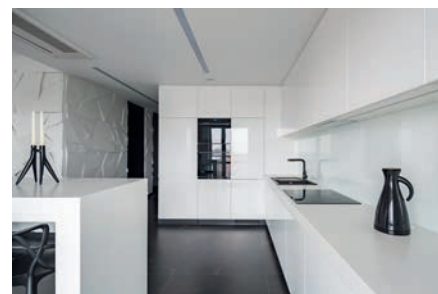
Indústria de móveis e cozinhas