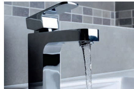
Fabrico de torneiras