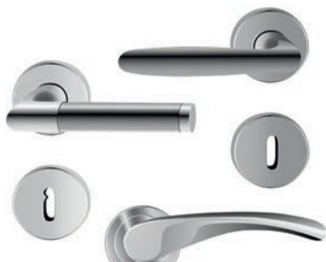
Fabrico de ferragens