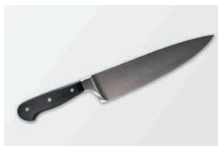
Cutelaria e facas