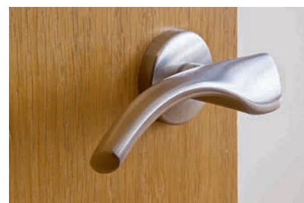
Ferragens e puxadores