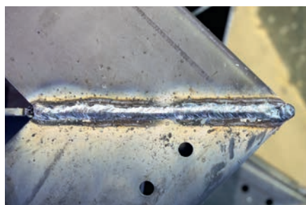
Revisão de juntas de soldadura