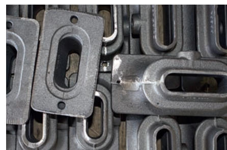
Rebarbamento de peças fundidas