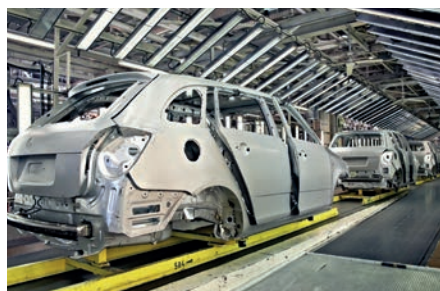
Indústria do automóvel | KTL Primer