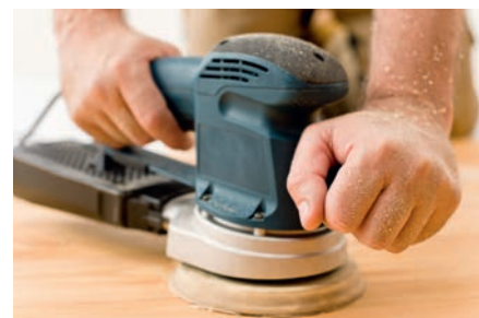
Indústria da madeira e do mobiliário