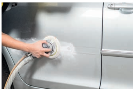
Reparação de automóveis