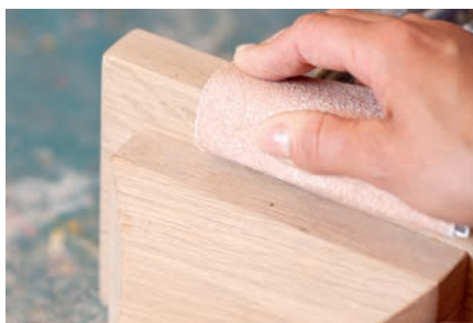
Lixagem manual na indústria da madeira