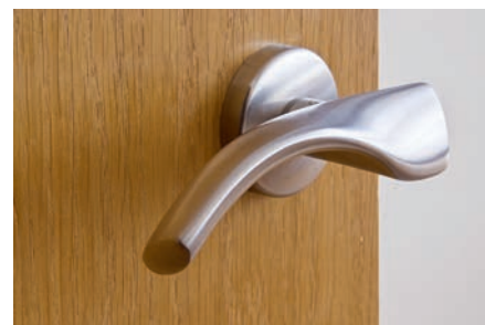
Ferragens e puxadores em alumínio