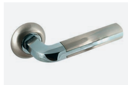
Ferragens e puxadores