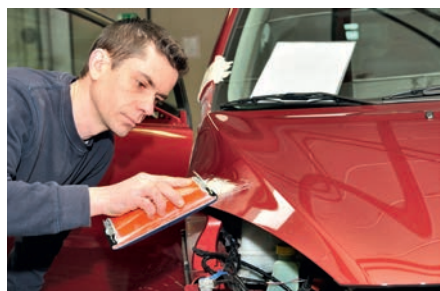
Reparação do automóvel