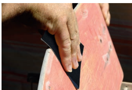
Móveis e madeira em geral