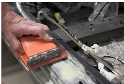
Lixagem manual - Carroçaria