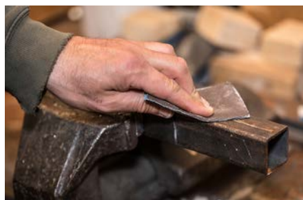
Lixagem manual geral - Metalomecânica