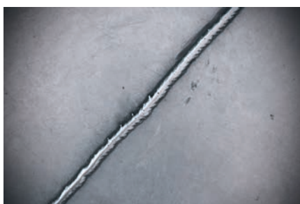
Cordão de solda