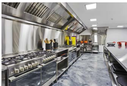
Cozinhas industriais em aço inox