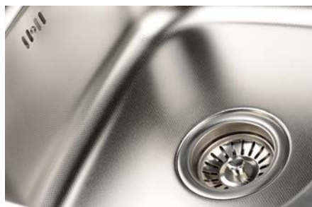
Lava-louças de aço inox