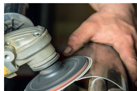
Lixagem de chapas