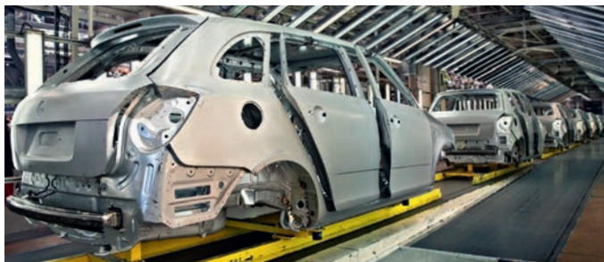
Indústria do automóvel - massas