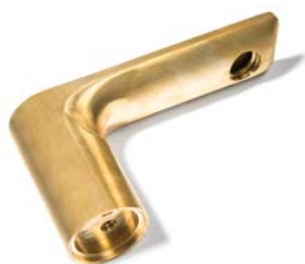
Indústria de ferragens