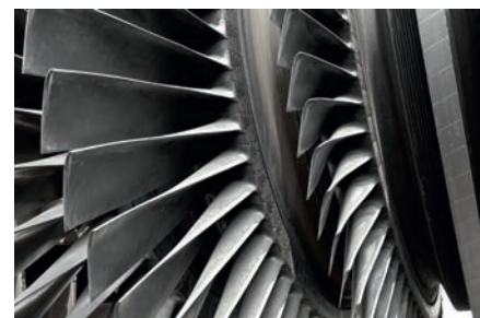
Pás de turbinas