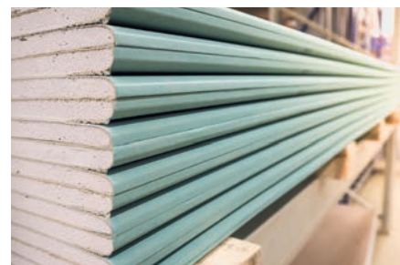
Placas de gesso e fibrocimento