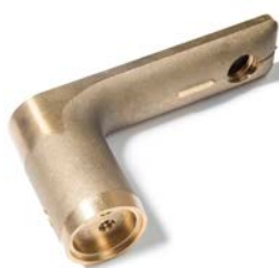
Indústria de ferragens