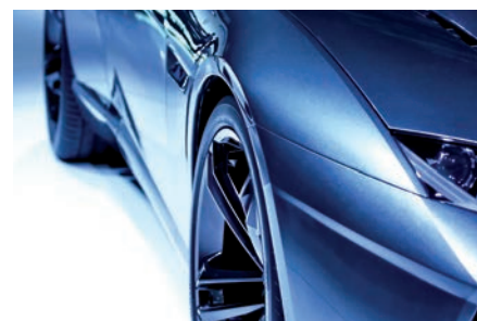
Indústria do automóvel | Remoção de defeitos de lacagem